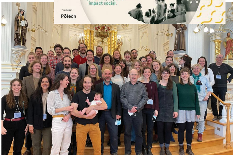
Événement Lab créatik dans Charlevoix