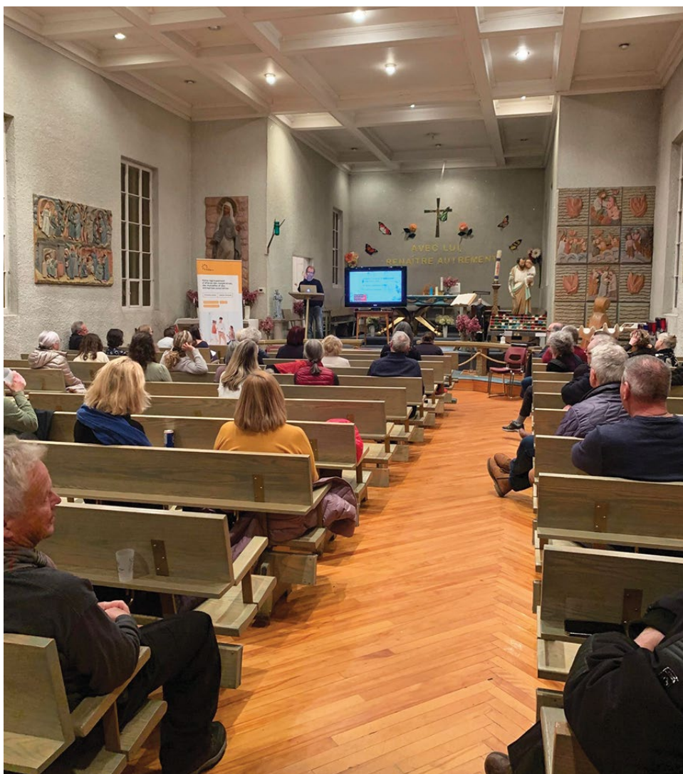
Événement à St-Joseph-de-la Rive dans le cadre du mois de l'économie sociale